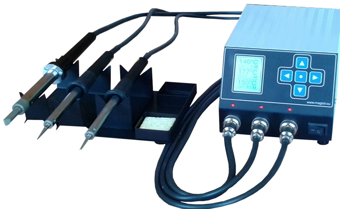
Фото 1. Общий вид станции

Паяльная станция состоит из блока управления и паяльных инструментов. Блок управления выполнен в металлическом корпусе и имеет полную гальваническую развязку от питающей сети. На передней панели блока управления расположены сетевой выключатель, разъемные соединители для подключения трех паяльных инструментов, световые индикаторы подключения инструментов, жидкокристаллический дисплей и пятикнопочная клавиатура. На задней панели блока управления находятся сетевой шнур, плавкий предохранитель (5А) и клемма для подключения заземления.